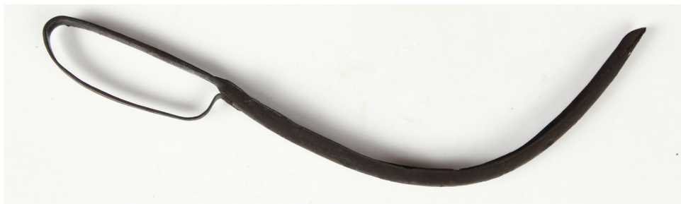
Græsk bronzestrigel fra 5. årh. fvt., deponeret af Nationalmuseet, ChrVIII829, K114

En række genstande blev konserveret hos Konserveringsafdelingen på Moesgård Museum under den gamle amtskonserveringsordning. Det drejer sig om en større gruppe af bronzegenstande fra den store samling fra Karthago deponeret fra Ringkøbing Museum, hvor den første del blev konserveret i 2010 og den resterende i 2011.