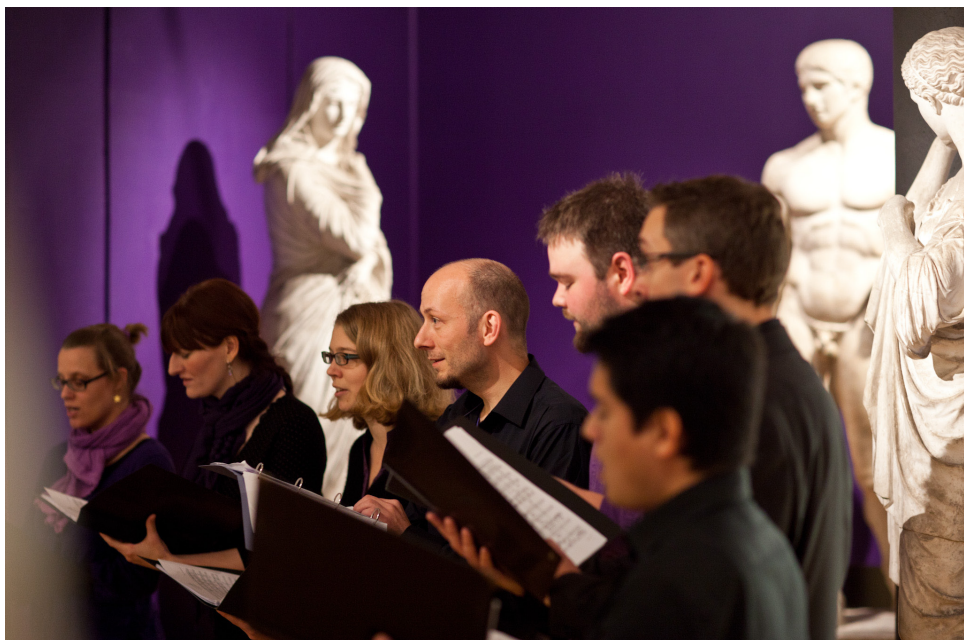
Koret Coro Cordis underholder i anledning af boglancering og åbning af udstillingen Antikkens Verden 7. november 2011.