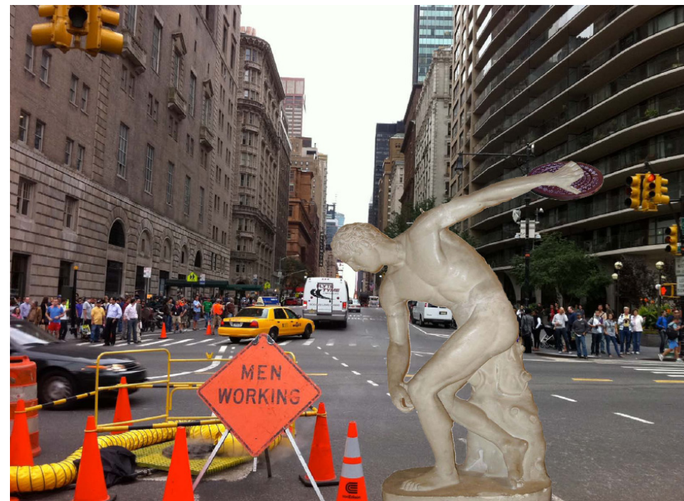
Diskoskasteren fortolket af elever fra Viby Gymnasium i regi af Intrafaceprojektet, foråret 2011.