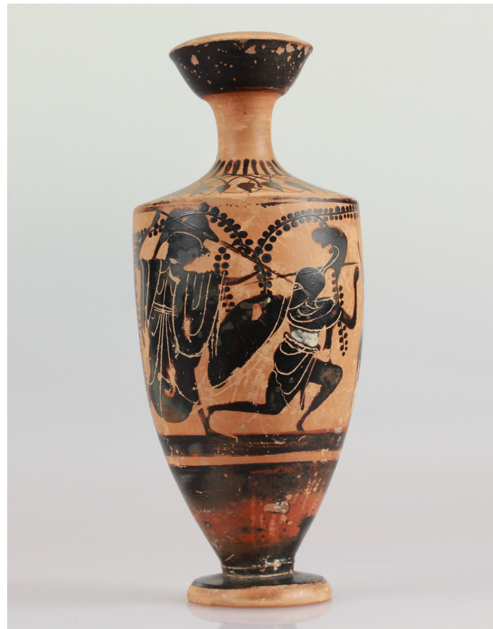
Attisk sortfigurs lekyth med Athena, der kæmper mod en gigant, deponeret af Nationalmuseet 5614, K109